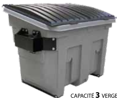
CAPACITÉ 3 VERGES CUBE