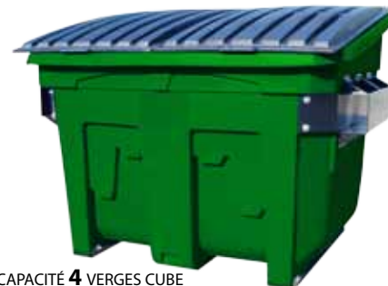
CAPACITÉ 4 VERGES CUBE