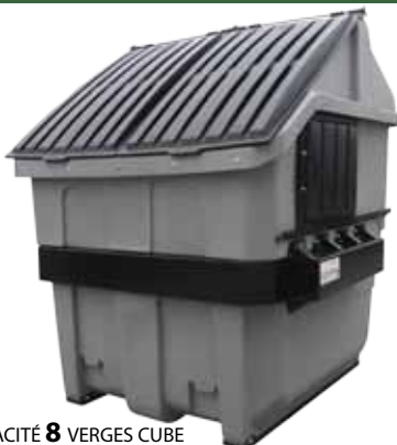
CAPACITÉ 8 VERGES CUBE