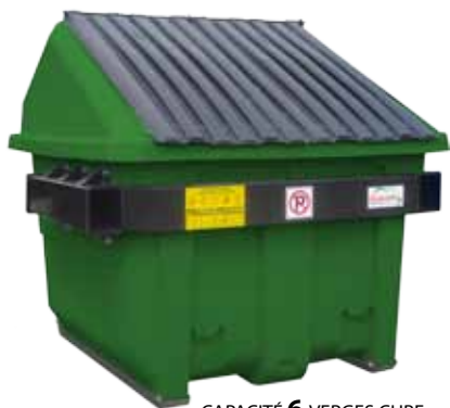
CAPACITÉ 6 VERGES CUBE