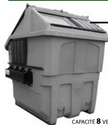
CAPACITÉ 8 VERGES CUBE

OPTION: Accès conçu pour quai de chargement