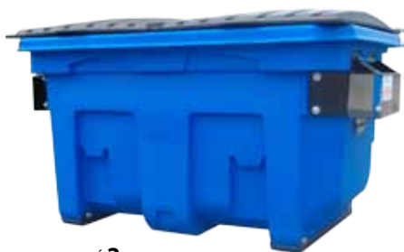
CAPACITÉ 2 VERGES CUBE